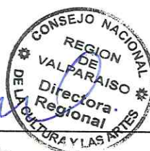
Nélida Pozo Kudo